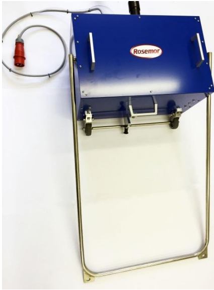
Die T10 für die Verwendung mit der Rotomac.

Für Anwender, die keine Fahrtreppen reinigen möchten und nur eine Reinigungslösung für ihre Laufbänder benötigen, wurde die T10i entwickelt. Sie kommt unter anderem auch in Flughäfen zum Einsatz, wo durch die hohe Zahl der Laufbänder und engen Reinigungszeiträumen eine Maschine nur für diesen Zweck wirtschaftlich Sinn ergibt. Das transportable Gerät besteht unter anderem aus der T10. Anwender, die auch eine Rotomac einsetzen, haben so alle drei Optionen vereint und können auf eine komplette Lösung für die Reinigung von Fahrtreppen und Laufbändern zurückgreifen.