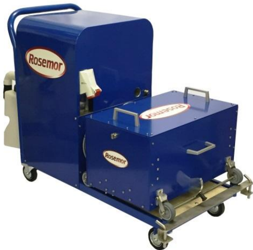
Die T10 beinhaltet unter anderem die T10i.

Für Anwender, die keine Fahrtreppen reinigen möchten und nur eine Reinigungslösung für ihre Laufbänder benötigen, wurde die T10i entwickelt. Sie kommt unter anderem auch in Flughäfen zum Einsatz, wo durch die hohe Zahl der Laufbänder und engen Reinigungszeiträumen eine Maschine nur für diesen Zweck wirtschaftlich Sinn ergibt. Das transportable Gerät besteht unter anderem aus der T10. Anwender, die auch eine Rotomac einsetzen, haben so alle drei Optionen vereint und können auf eine komplette Lösung für die Reinigung von Fahrtreppen und Laufbändern zurückgreifen.